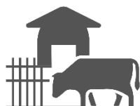
Riesgo dado por las instalaciones

De acuerdo a La Manna y Malcuori (2007), el riesgo predial es aquel dado por las instalaciones que posee el tambo y el manejo que realiza el productor (horas de ordeño, suplementación en patios de alimentación, las instalaciones de ordeño, caminería, uso de agua de limpieza etc.).