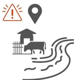
Riesgo Ambiental Geográfico

La Matriz de Riesgo Ambiental funciona con dos componentes: