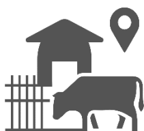
Ubicación geográfica sala de ordeño

Es aquel que está dado por la ubicación geográfica de la sala de ordeño, las pendientes, el tipo de suelo y la cercanía a fuentes de agua para consumo humano y animal, arroyos, ríos, napas, etc.