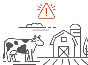
Riesgo Ambiental Predial